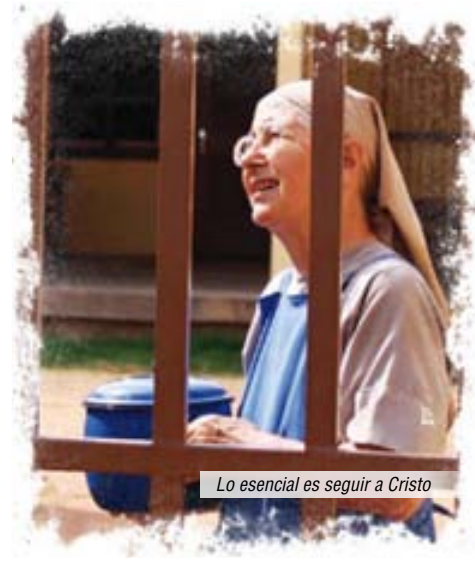
Lo esencial es seguir a Cristo