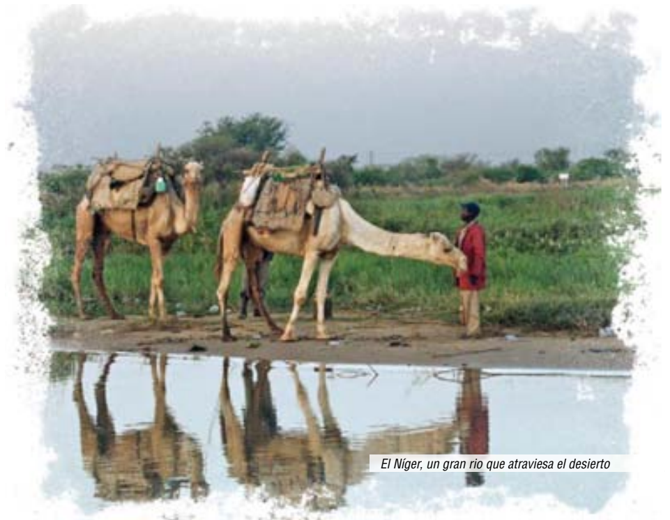
El Níger, un gran río que atraviesa el desierto

El Goruoi es una región situada en la frontera de Burkina Fasso, a 300 Km. al este de Niamey. Dentro de la etnia sonraï, islamizada en su mayoría, varios pueblos guardaban el culto a los antepasados como práctica religiosa esencial. Se les llamaba de forma peyorativa “kapos”, paganos. En esta tierra semidesértica, donde el Islam mostraba su poderosa influencia durante siglos, se va a fundar una comunidad cristiana gracias al tesón y profunda fe de Antoine Douramane.