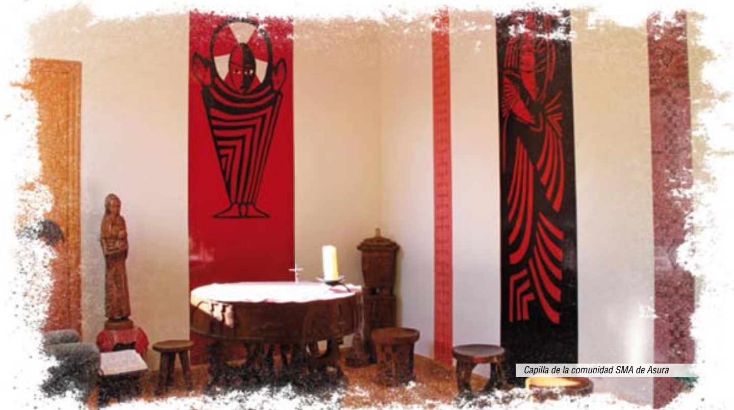
Capilla de la comunidad SMA de Asura

Es el Señor quien nos convoca, Él es quien nos reúne, el que da sentido a lo que somos y hacemos: a la venta de calendarios, a las catequesis misioneras, a nuestras reuniones, celebraciones y a nuestros donativos..., y ¿cómo podríamos hacerlo si no pasamos tiempo con Él?