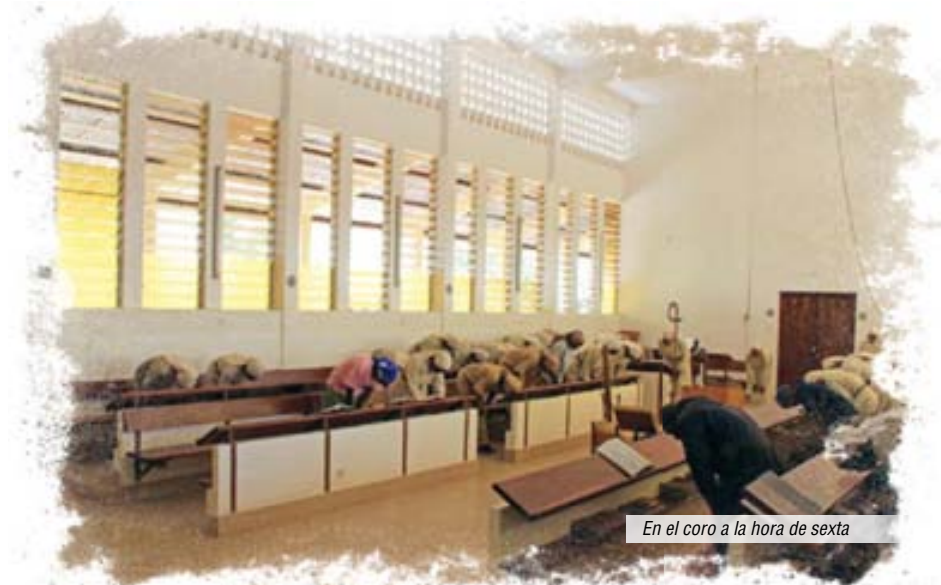
En el coro a la hora de sexta