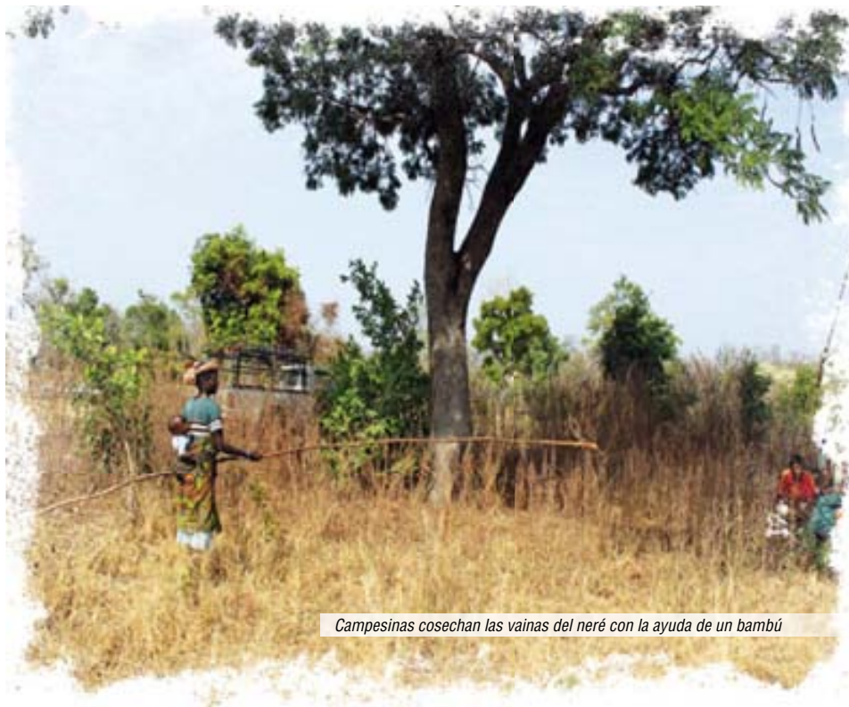
Campesinas cosechan las vainas del neré con la ayuda de un bambú

Para todas las actividades llamar al 91 300 00 41 o enviar un mail a la siguiente dirección: sma@misionesafricanas.org