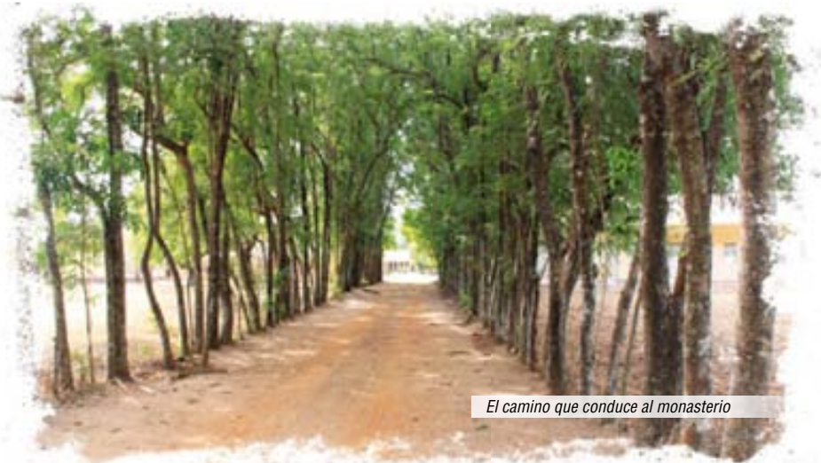
El camino que conduce al monasterio

- Mi gran deseo fue siempre buscar a Dios. Mi familia era musulmana, cantábamos canciones que decían que Dios nos podía condenar. Eso era una preocupación para mí, pero yo también leía la Biblia en yoruba; en mi familia se reían de mí, decían que la Biblia era mi almohada. Más tarde dejé el pueblo y llegué a Cotonou; allí viví con mi hermano mayor, que era cristiano. Los domingos iba a misa con una amiga. Un día, de pronto, me deja sola en el banco, se acerca al altar y vuelve; yo le pregunté a qué había ido y me dijo que a comulgar. “¿Por qué no me dijiste nada?”, le pregunté, “yo también quiero ir”. “Pero tú no puedes, tienes que ir a la catequesis, bautizarte y prepararte para recibir la comunión”. Y así lo hice; fui a la misión y comencé la catequesis.