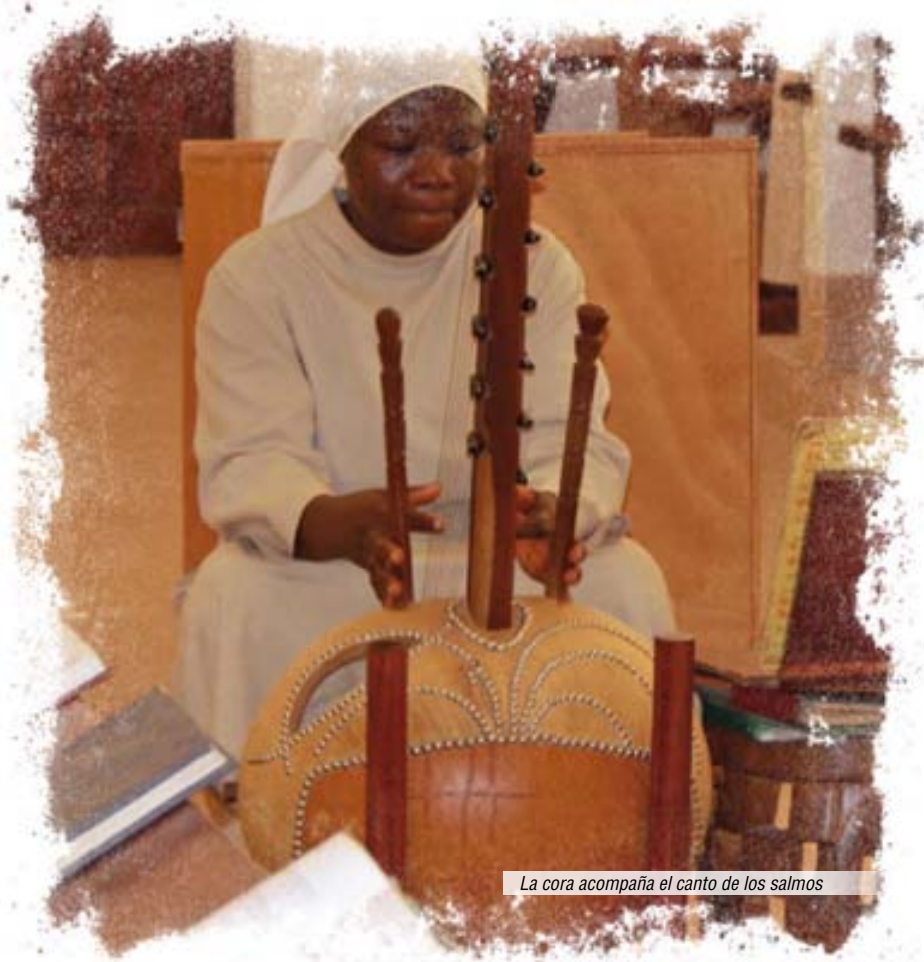
La cora acompaña el canto de los salmos

Volverme al mundo y soñar que lo que no encontré antes, si volviese ahora, lo encontraría. A veces sueño con un marido, riquezas, felicidad... En el sueño, lo paso mal; pero, al despertar y ver que todo era un sueño, le digo al Señor gracias porque no era más que un sueño, y sigo aquí.