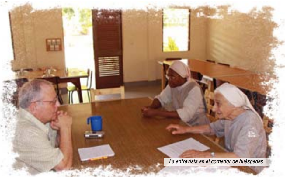
La entrevista en el comedor de huéspedes