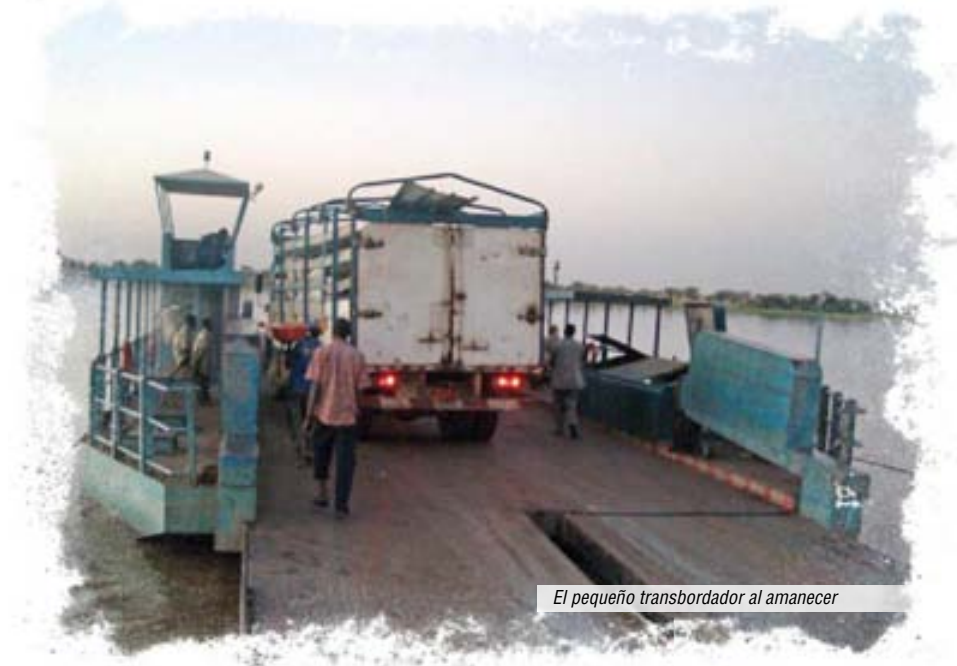
El pequeño transbordador al amanecer

roud no podrá satisfacer sus deseos pero le promete que hará todo lo posible por fundar esa misión.