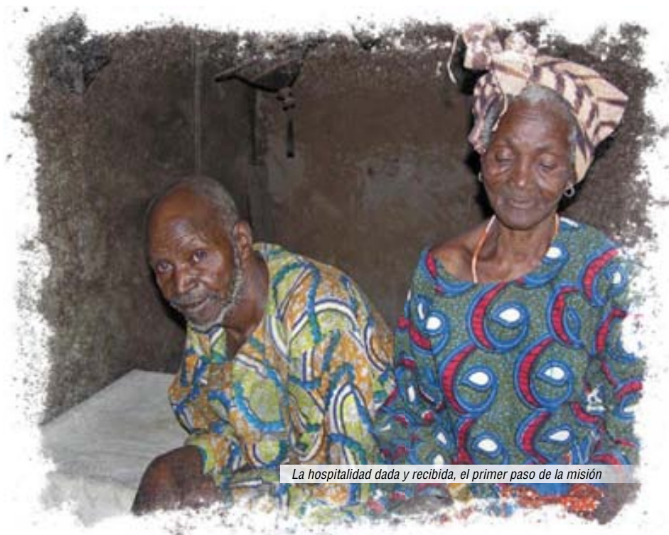
La hospitalidad dada y recibida, el primer paso de la misión

Por la tarde llagan a un lugar donde ha habido derramamiento de sangre. Los sonraï, excelentes arqueros, sorprenden a los tuaregs con sus camellos en sus pas-