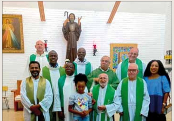
En la parroquia SMA de San Francisco de Paula, (Madrid).