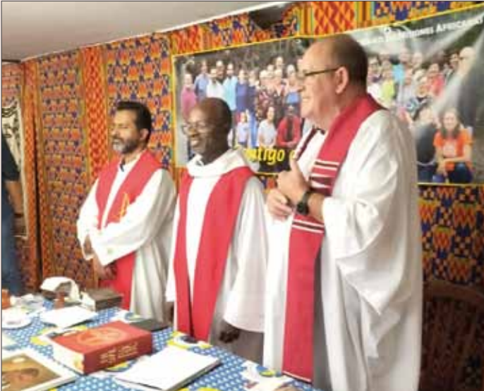
Celebrando misa en la casa SMA de Madrid.