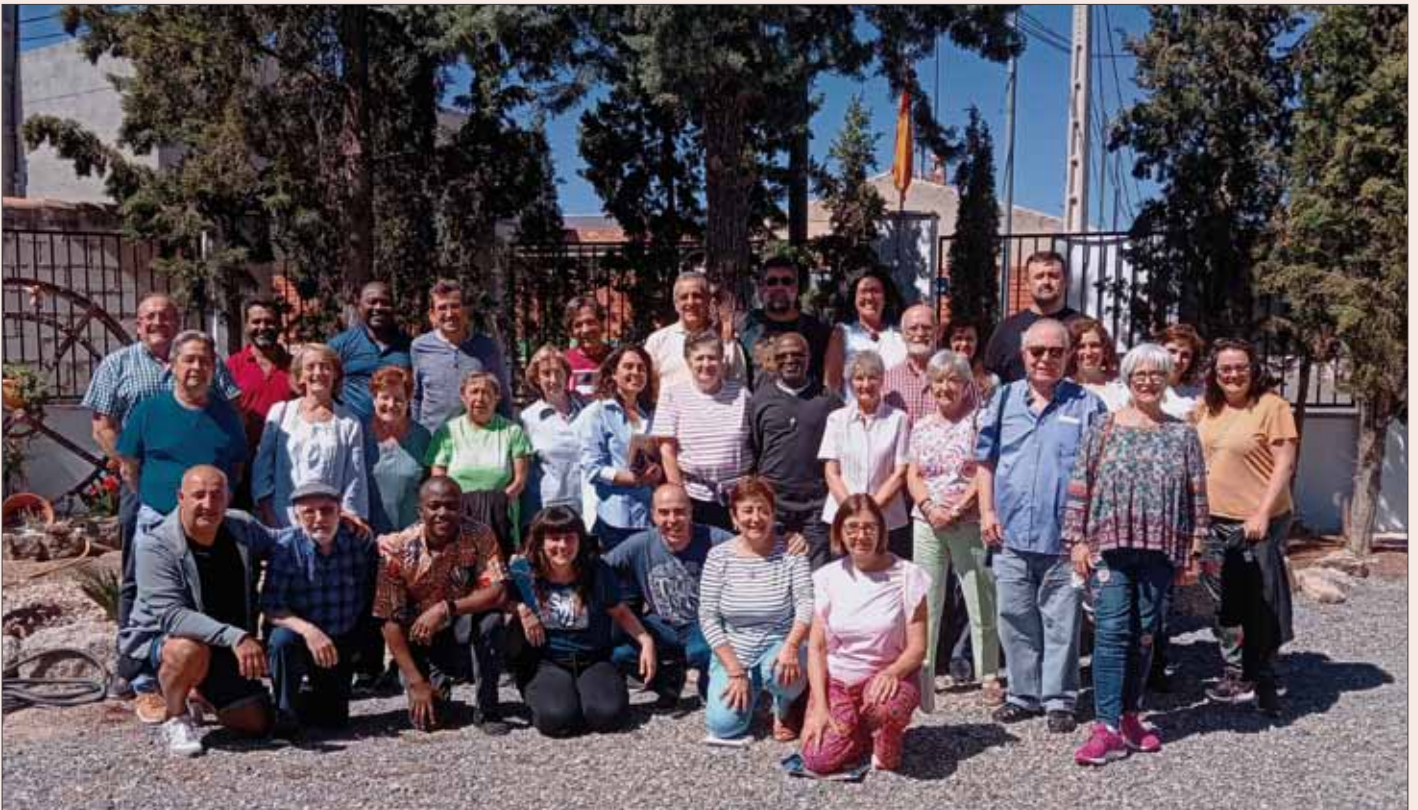
Sacerdotes y laicos en el encuentro Chueca 2024.