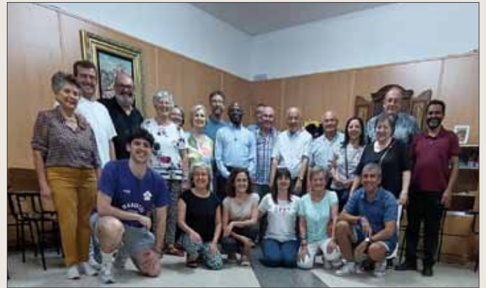
Los consejeros se reúnen con el Grupo SMA Granada.