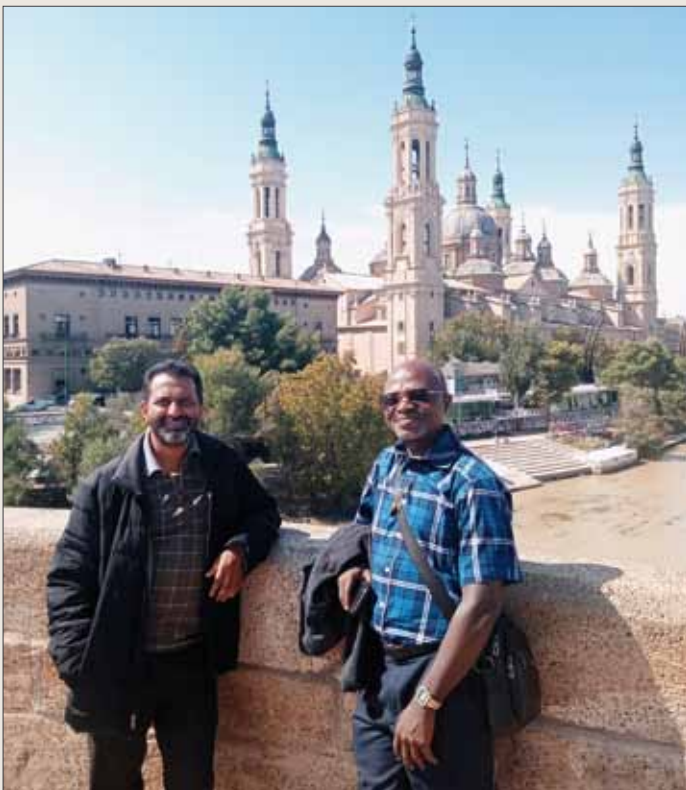
Los consejeros en Zaragoza. Al fondo la Basílica del Pilar.