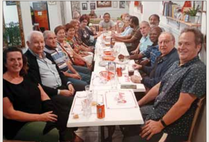
En animada y distendida charla, compartiendo un refrigerio con el grupo de Zaragoza.