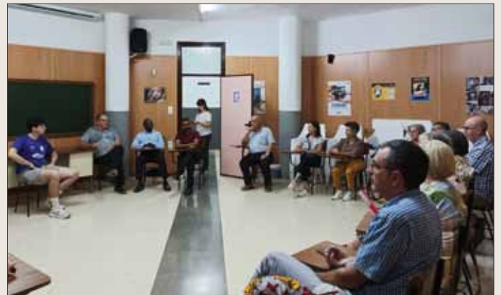
Fin de jornada celebrando el encuentro.

Al día siguiente volvemos a Granada donde, en la tarde, celebramos la eucaristía en la Parroquia San Juan de Ávila, que está hermanada con la SMA y donde el grupo sma se reúne todas las semanas. A continuación tuvimos un encuentro con el grupo de Granada donde les explicaron las diferentes actividades que realizaron este año como la lectura del libro “Tejiendo paraísos”, el taller de telas, las oraciones, el campamento y la comida solidaria. El Consejo agradeció su compromiso misionero y les animó a seguir colaborando diciéndoles que nada de lo que hacemos, por pequeño que sea, queda sin dar fruto. Un rato cordial en torno a una cerveza manifestó nuestra amistad y el espíritu de familia.