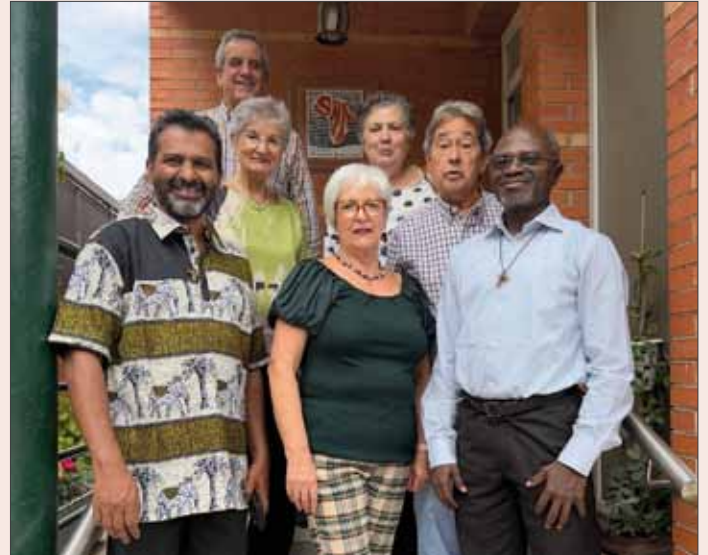
En la casa de Asura con algunos miembros honorarios.

que mantengamos la mirada fija en los signos de esperanza que nos llegan de Dios. La fe adquiere todo su significado cuando todo parece imposible. Con Dios, el Maestro de la historia, todo es posible. Con cada uno de nosotros creyentes, fuertes en